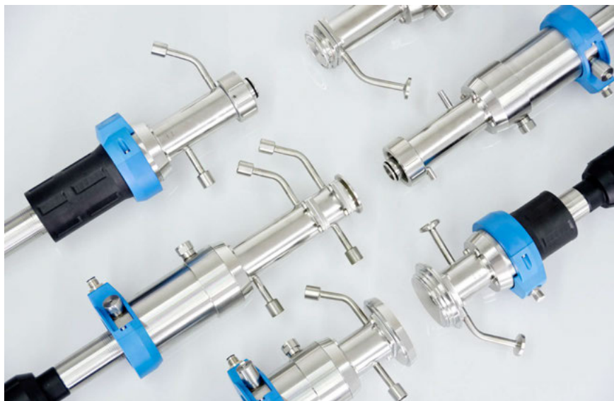
Zahlreiche Anschlussmöglichkeiten für jede Einbausituation.