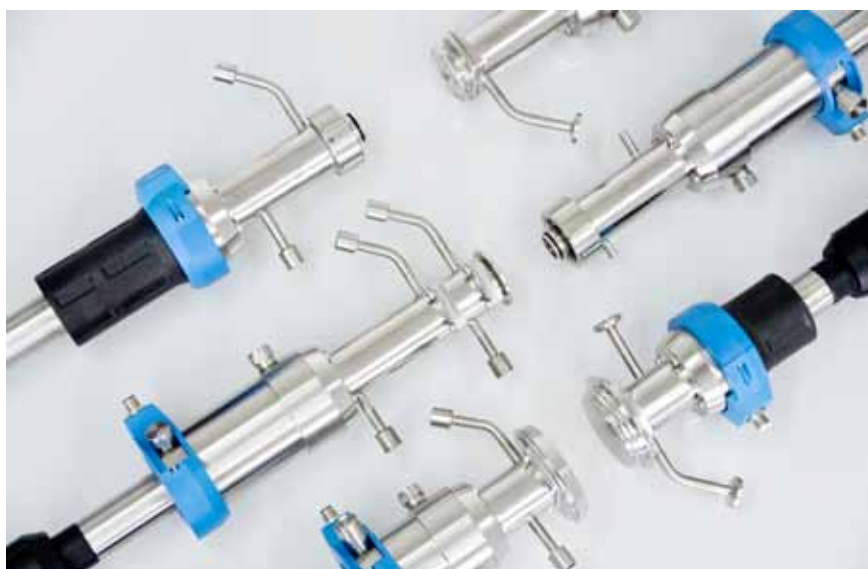
Grand choix de raccords disponibles en fonction de l'installation.