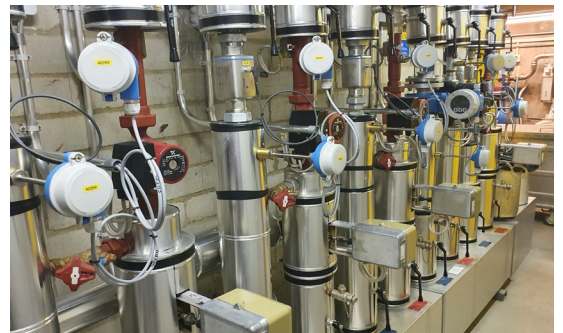
Energiemessungen im Keller des Schulhauses

Ettingen ist eine Gemeinde im Bezirk Arlesheim und gehört zum Kanton Basel-Landschaft in der Schweiz. Das Dorf liegt im Leimen- beziehungsweise Birsigtal am Fusse des Blauen und befasst sich nachhaltig mit der effizienten Nutzung von Energie, dem Klimaschutz, erneuerbarer Energie sowie umweltverträglicher Mobilität.