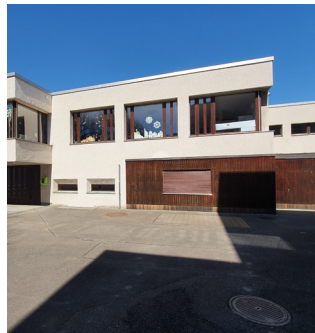
Schulhaus Gemeinde Ettingen