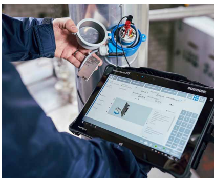
Field Xpert SMT70 bietet viele nützliche Funktionen

Die Field Xpert SMT70 Software ist intelligent und leistungsstark. "Damit verfügen wir nun über eine perfekte mobile Plattform, die es uns ermöglichen wird, in den kommenden Jahren voranzukommen", sagt der E&I-Verantwortliche. "Nebst der enormen Benutzerfreundlichkeit bieten die neuen Tablets auch einen deutlichen Geschwindigkeitsgewinn. Sie lassen sich sehr schnell mit den Feldgeräten verbinden, deren korrekte Funktion Sie sofort überprüfen können. Wenn Sie die Parametereinstellungen 'im Feld' ändern, wird sofort eine neue PDF-Datei erstellt. Wenn Sie das Tablet bei Ihrer Rückkehr ins Büro in die Docking-Station stellen, wird das PDF automatisch auf dem Server abgelegt, so dass die Gerätedaten immer auf dem neuesten Stand sind. Dies ist auch ein großer Vorteil beim Austausch eines Feldgerätes. Wir haben jetzt drei Field Xpert SMT70 Tablets im Einsatz und sind noch dabei, neue nützliche Funktionen zu entdecken. Alle in unserer Abteilung arbeiten gerne mit ihnen!"