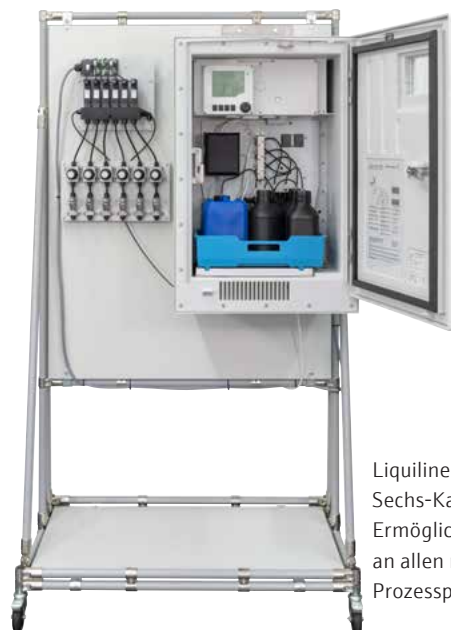
Liquiline System CA80SI Sechs-Kanal-Ausführung: Ermöglicht die Probenahme an allen notwendigen Prozesspunkten.

Die Online-Kieselsäuremessung im Speisewasser, das vom Kondensator zum Kessel zurückfließt, ermöglicht eine schnelle Erkennung von Verunreinigungen und Kühlwasserlecks im Kondensator.